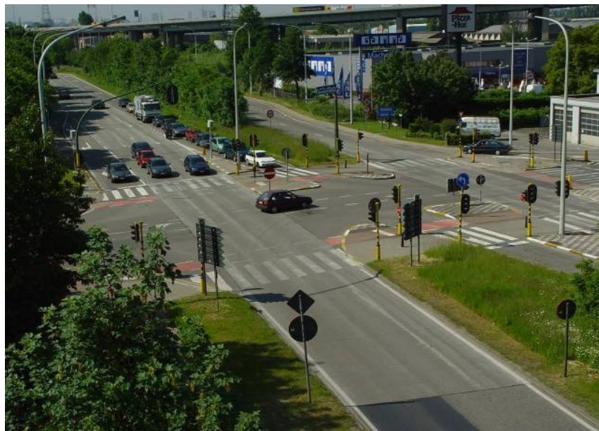
Whitetopping-Bauweise (Instandsetzung) im Kreuzungsbereich

Für weitere Informationen kontaktieren Sie bitte: